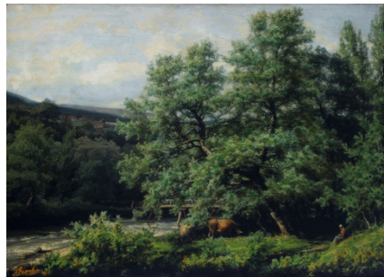
AGUSTÍN DE RIANCHO. La Cajigona .

MAS | MUSEO DE ARTE MODERNO Y CONTEMPORÁNEO DE SANTANDER Y CANTABRIA