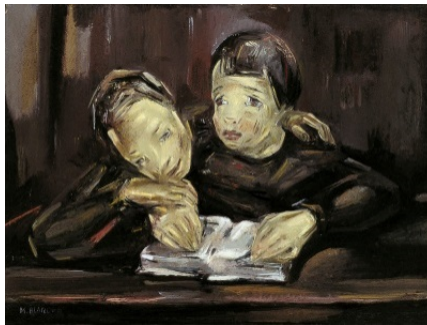
MARÍA BLANCHARD. Niñas leyendo

Un nuevo y gran proyecto expositivo denominado TERRA / aqua ve la luz inaugural el viernes 6 de marzo de 2020 a las 19:30 horas, volviendo a erigirse en una copiosa y gran coproducción entre el MAS del Ayuntamiento de Santander (MAS | Museo de Arte Moderno y Contemporáneo de Santander y Cantabria) y la Fundación Caja Cantabria. Se trata del segundo capítulo de la exposición AQUA | terra que tuvo lugar en el pasado otoño de 2019. Se exhibe en dos plantas del Edificio CASYC de la calle Tantín. Y nuevamente, la particularidad radica en que solamente se cuenta con obras artísticas y documentación propiedad de ambas instituciones, de sus propias colecciones, aunando esfuerzos, proyectos y objetivos, poniendo en valor el propio patrimonio artístico que se eleva a más de cuatro mil piezas.